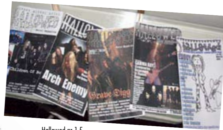
Hallowed nr 1-5 Papperstidningsutgåvan

Ni som är sugna på att göra en recension då och då får också gärna höra av er. Duger ni inget till är det värsta som kan hända att vi säger att ni är usla. Är ni skrivande genier är ni förstås självskrivna att få göra en skiv-