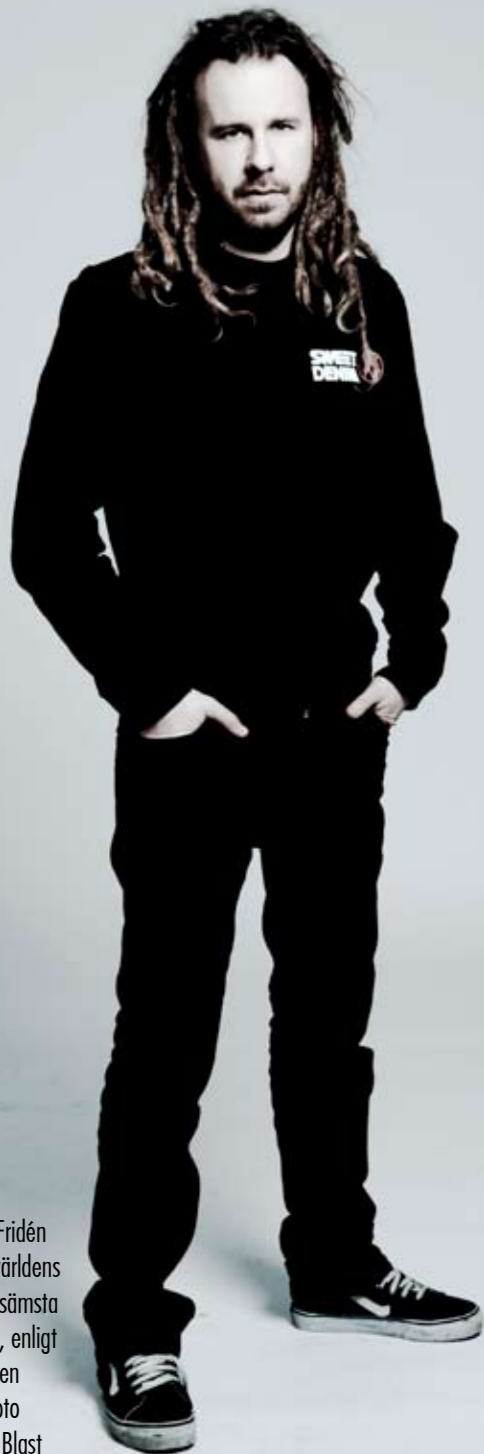
Anders Fridén - metalvärldens kanske sämsta sångare, enligt hans egen tröja.