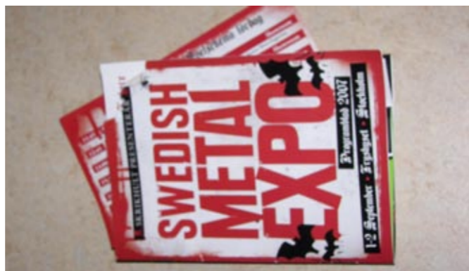
Tidsschema och programblad, något man ej bör gå utan på expon

Vad jag minns från årets expo är inte banden som spelade, signeringarna eller någon av föreläsningarna/diskussionerna, det är den trevliga stämningen”