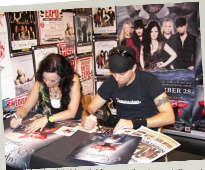
Nightwish, två därifrån i alla fall, signerar allt möjligt som de får tag på