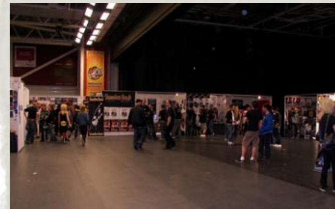
Utställningsområdet, ena delen av det i alla fall