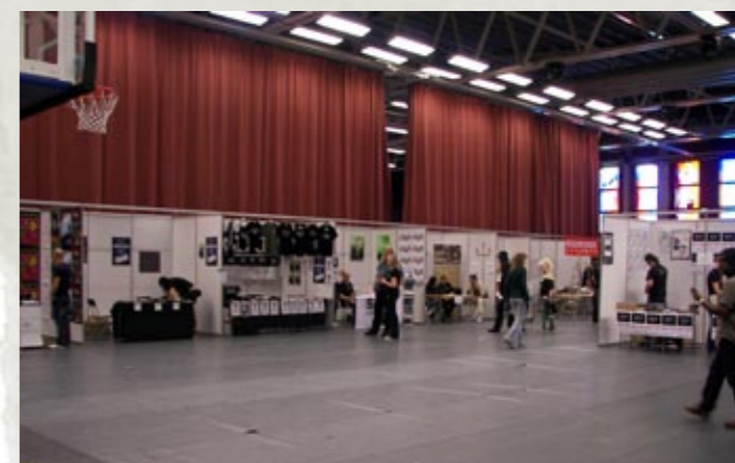
Utställningsområdet, den andra delen av det i alla fall