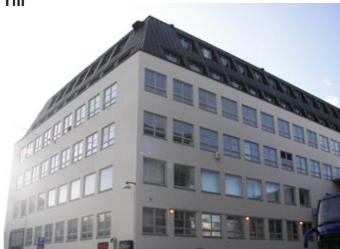
Fryshuset, här inne hålls Swedish Metal Expo

Text: Caj Källmalm Swedish metal expo var 1-2 september 2007