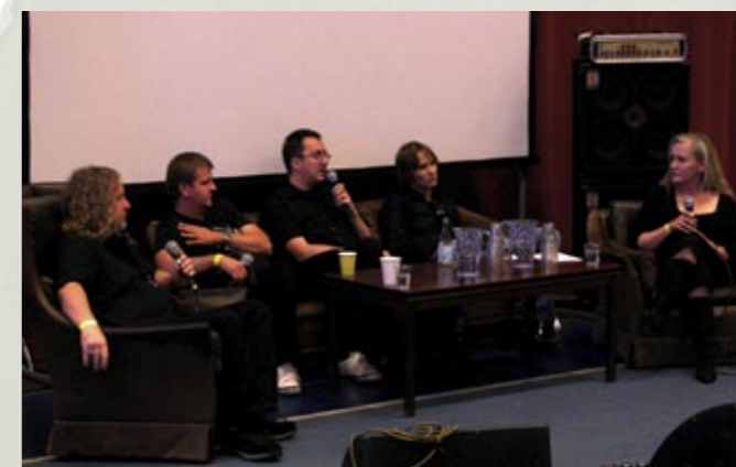
Paneldiskussion, just denna om hur man gör för att lyckas i branchen