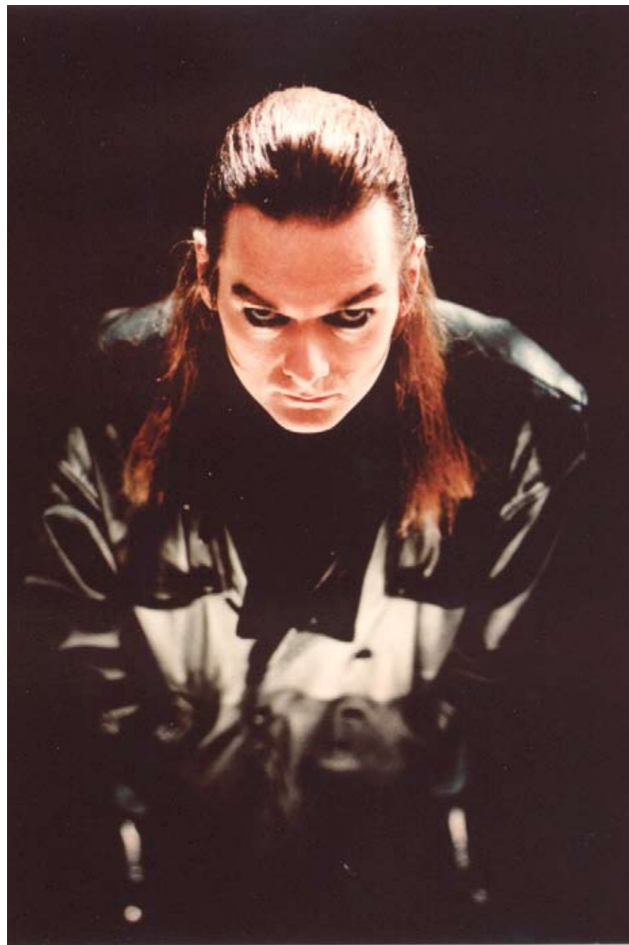
Arjen i ett gammalt promofoto, från Flight of The Migrator från 2000.

- You can't explain what's funny, it just is. - Ah, there is always the human equation.