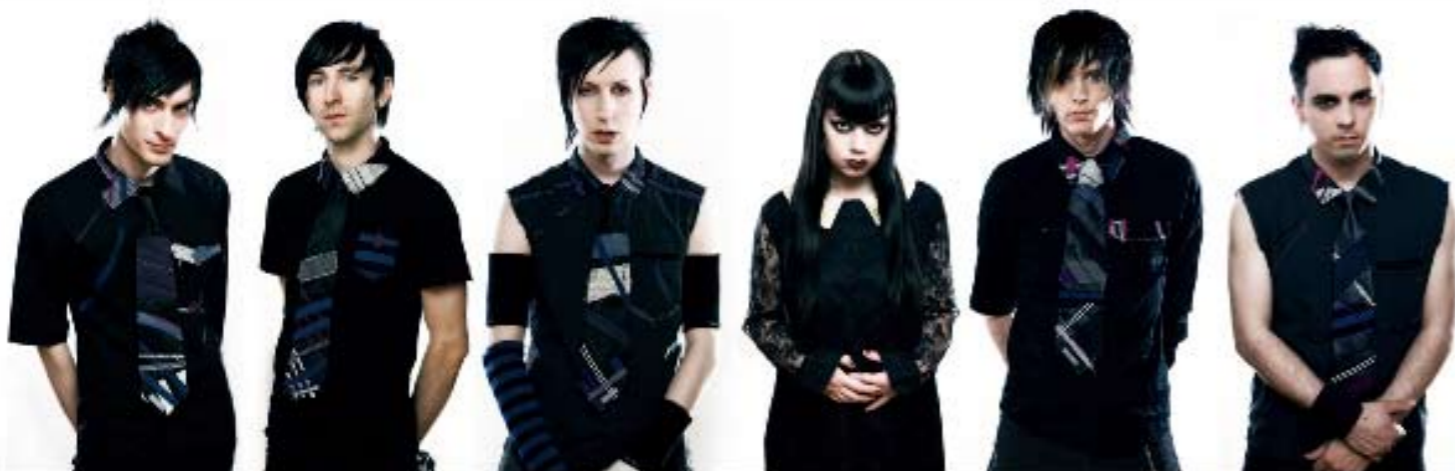
The Birthday Massacre, t.v. Dark Tranquillity, t.h.

Text: Caj Källmalm